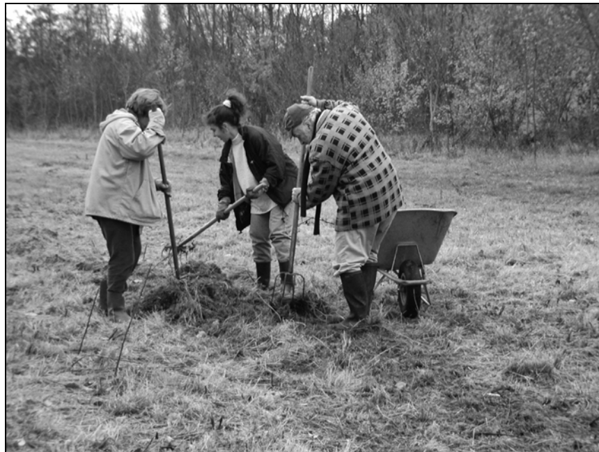
Gestion / Beheer 08/11/2003