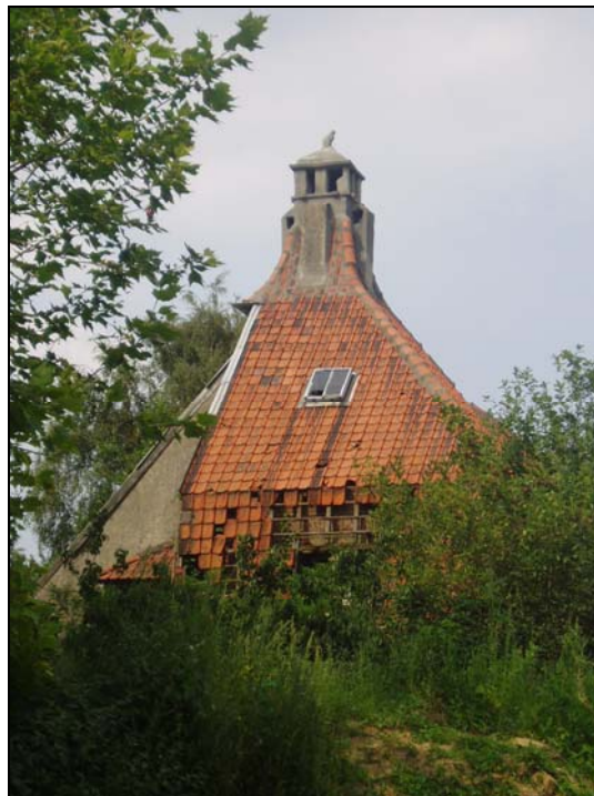
Kattekasteel anno 2004