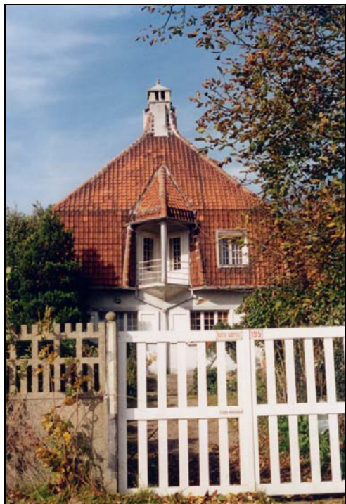
Kattekasteel anno 1994