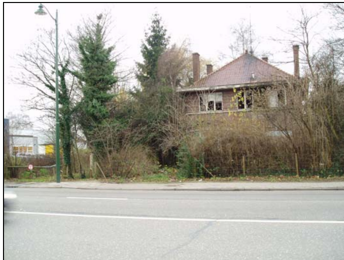
Habitation n°1447, chssée. de Mons / Woning nr. 1447, Bergense steenweg