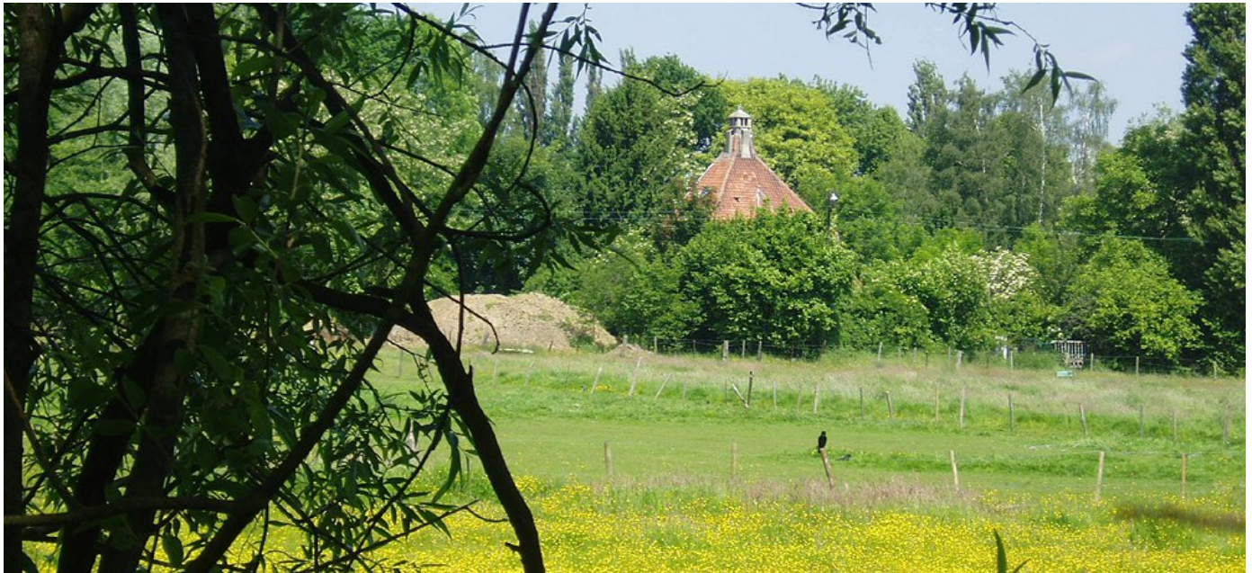
Vallée du Vogelzangbeek & Kattekesteel / Vogelzangbeekvallei met Kattekesteel