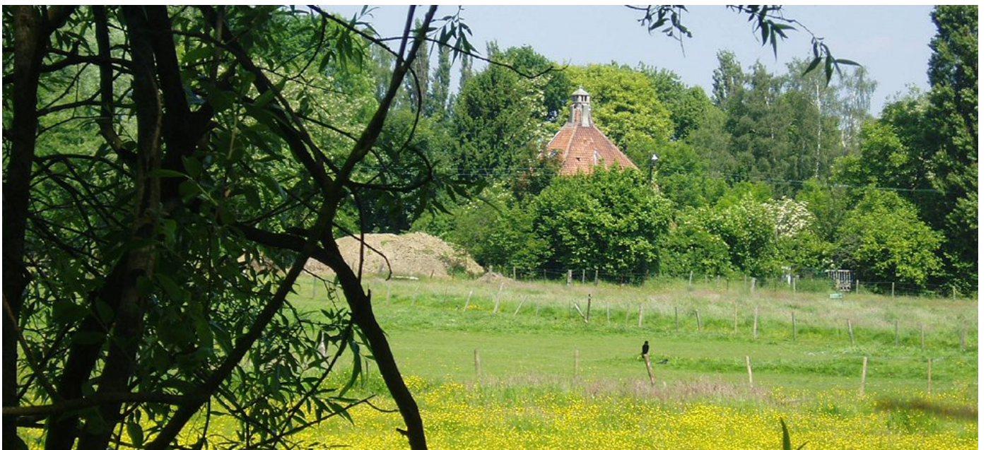
Vallée du Vogelzangbeek & Kattekasteel / Vogelzangbeekvallei met Kattekasteel

Zij was er altijd voor iedereen en iedereen heeft haar nodig. De Mens, die dikwijls de oorzaak is van haar aftakeling en vernietiging, kan (en moet) zich ook inzetten om dit erfgoed te redden en te behouden voor de volgende generaties. Dit moet niet alleen op wereldniveau gebeuren maar ook dicht bij ons. Wij trachten, met onze middelen, dit principe toe te passen in de Vogelzangbeekvallei. Dat is niet altijd gemakkelijk en we waarderen dus enorm de hulp van iedereen die hiermee het voorbeeld volgt van onze sponsors. De erkenning van onze doelstellingen en van de gegrondheid van onze projecten door hen is onontbeerlijk om deze te kunnen verwezenlijken. Het is dan ook "de" gelegenheid om iedereen die ons helpt of steunt bij onze acties te bedanken, zowel de donateurs, de verenigingen, de wijkcomités, de vrijwilligers als de autoriteiten.